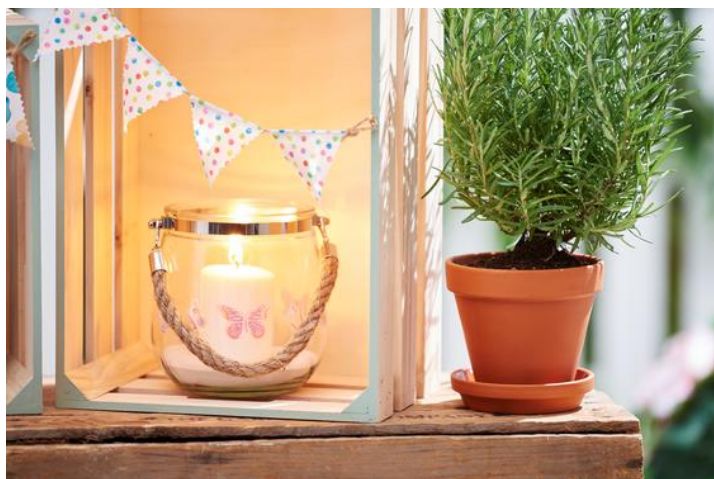
photophore avec motif de transfert

Positionne-les sur le site photophore et colle-les avec vernis pour serviettes . Applique le moins possible de vernis sur le verre au-delà du motif. tu peux gratter le surplus de vernis avec une brochette en bambou ou l'enlever délicatement avec un nettoyant universel.