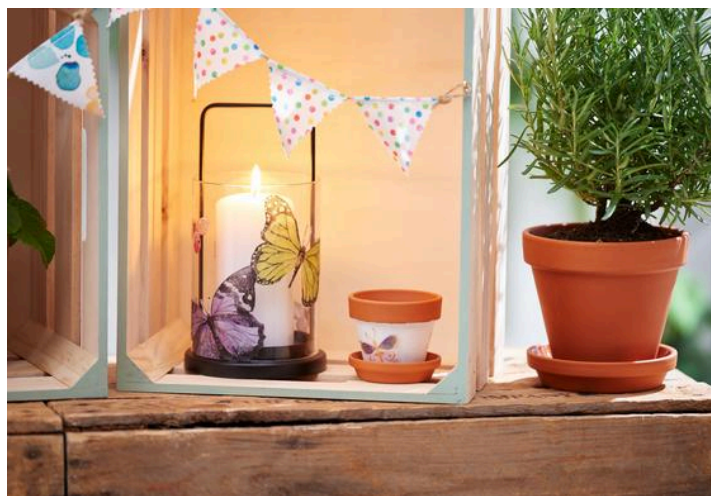
Serviettage sur verre