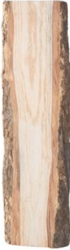
Planche de chêne non déignée