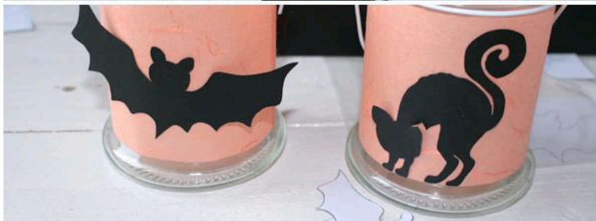
Étape 3 : Éclairage final