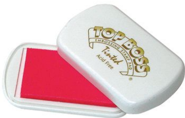
Coussin encreur pour tampon à embosser, env. 5,5 x 8,5 cm