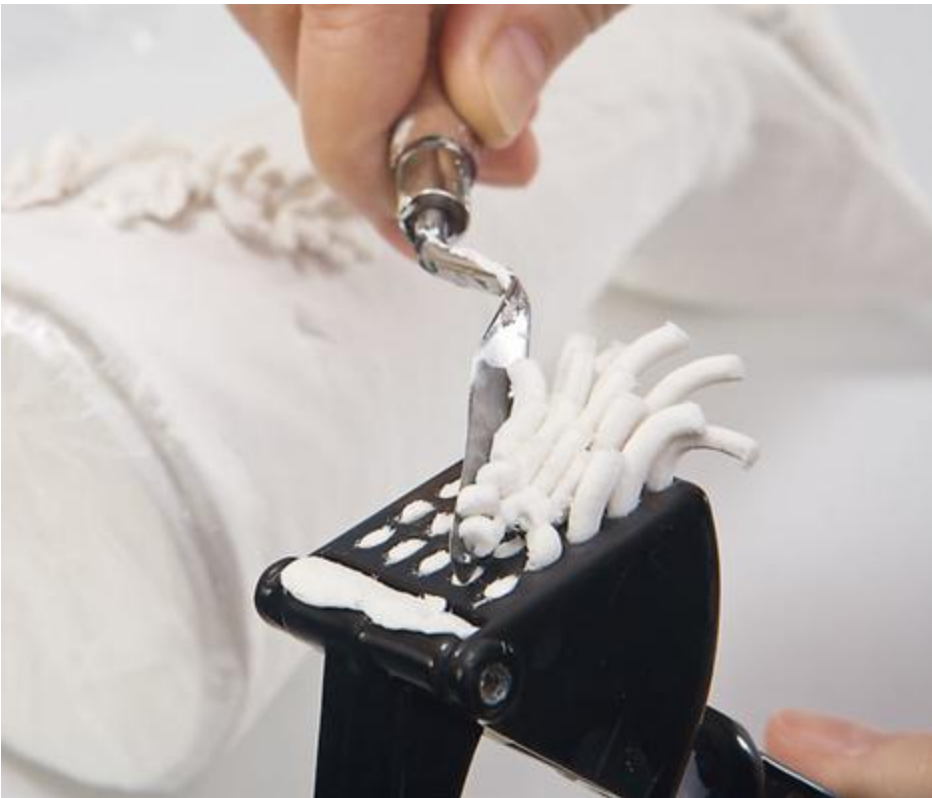
Modeler une toison de mouton

Entortillez une grosse cordelette de laine à feutrer et collez-la à l'intérieur des sabots et du corps du mouton. Enfin, faites un nœud avec le ruban à pois , collez-le à chaud dans le cou du mouton et placez les lunettes.