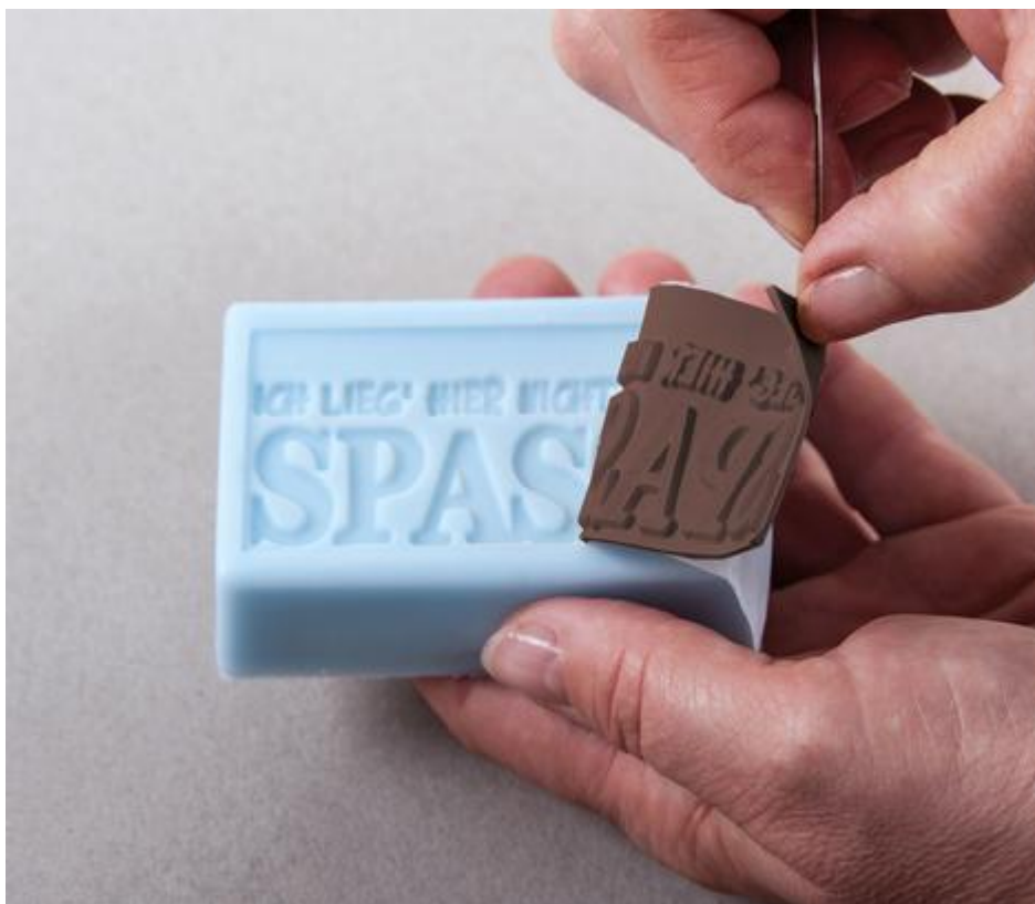
3°) Démouler délicatement le savon et retirez le tampon.