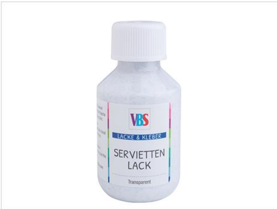
Colle-verniss à paillettes pour serviette

Essayez la technique sur d'autres surfaces :