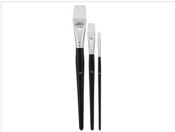
Pinceau pour serviette

Pour cette technique créative, vous avez besoin, en plus de l'objet à décorer , d'une serviette en papier avec un motif de votre choix, d'une paire de ciseaux pincettes , d'un pinceau pour serviette , ainsi que de la colle-vernis pour serviettes .