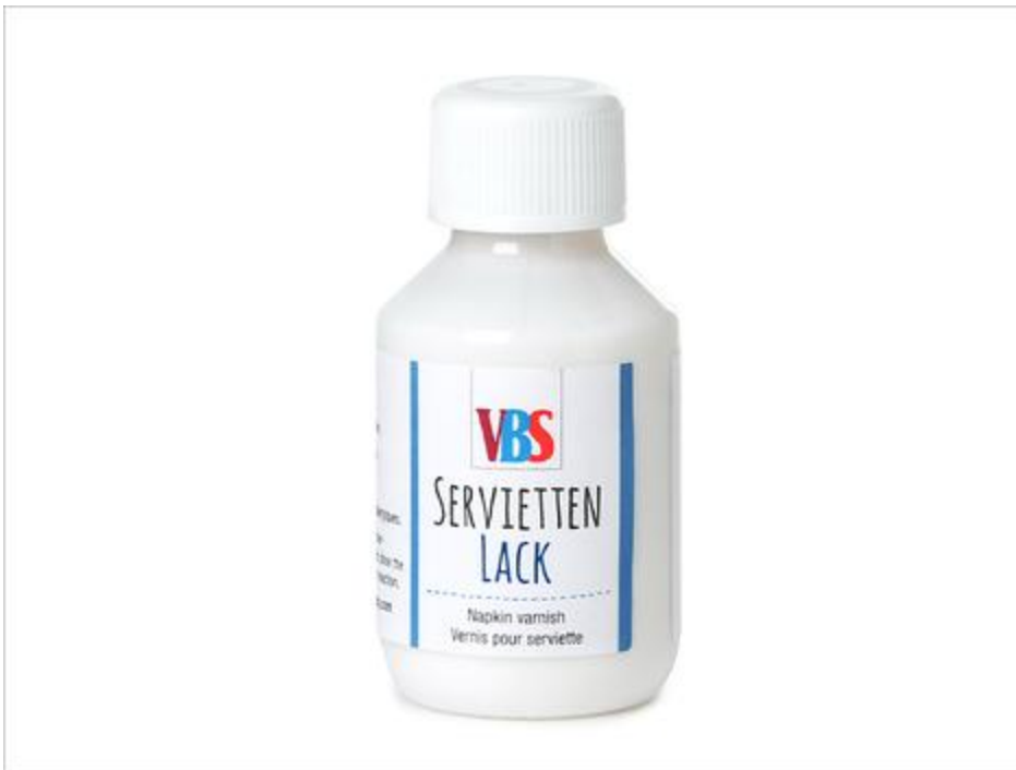
Colle-verniss pour serviette brillant