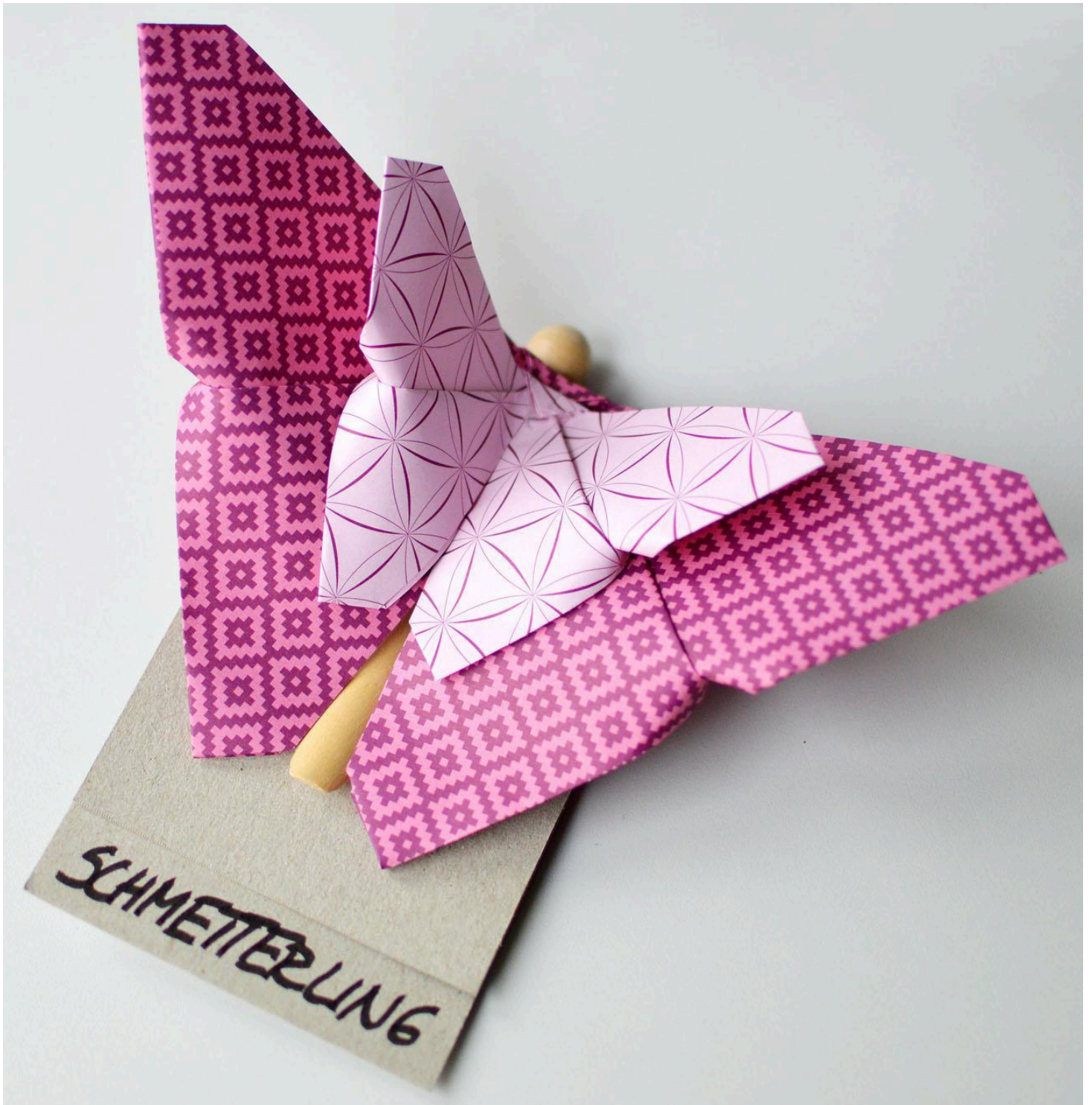
table. Laisse libre cours à ta créativité et décore ton intérieur avec de ravissants papillons papier!