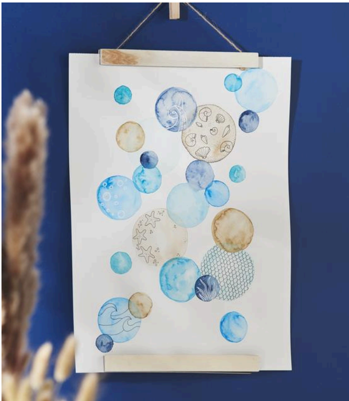
Tableau avec des animaux marins