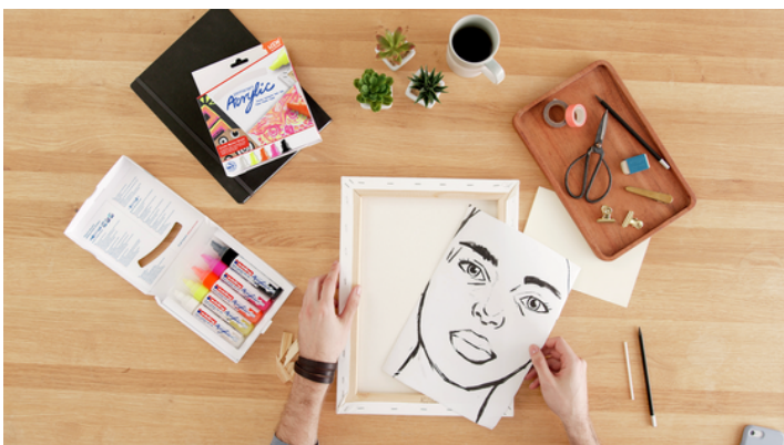
Étape 1 :