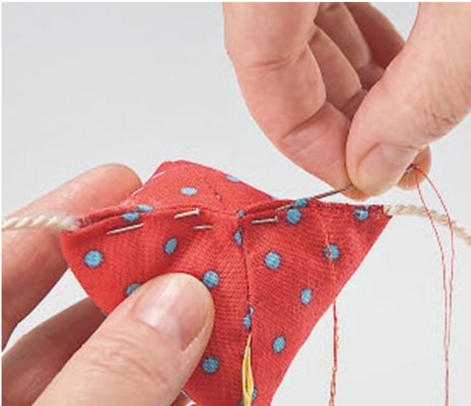
Fermerture au point de piqûre